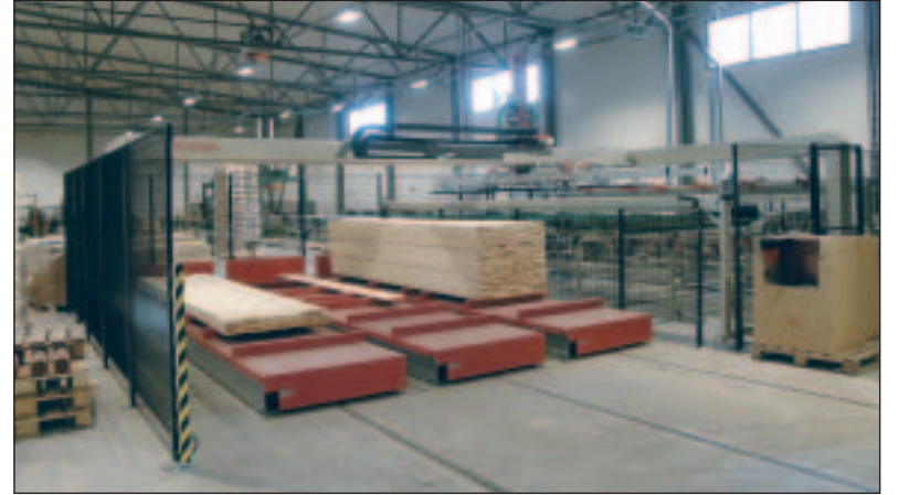
Yhtäaikaisesti voidaan käyttää kolmea sahatavarapituutta, jolloin omat pinoasemat sivuun siirtyvillä vaunuilla.

Tuotantoerä (esim. 1 päivä) annetaan suoraan tuotannonohjauksesta katkaisusahan optimointiohjelmalle. Katkaisusaha ja Pinomaticin laitteisto kommunikoi keskenään EtherNet-väylän kautta. Pinomaticin järjestelmä kertoo mitä sahatavarapituuksia on käytettävissä (maksimissaan 3 eri pituutta) ja saha tilaa oikean määrän oikean pituisia lautoja, joista Pinomaticin laitteisto valmistaa pikku nippuja sahan syöttöön. Katkaisus-