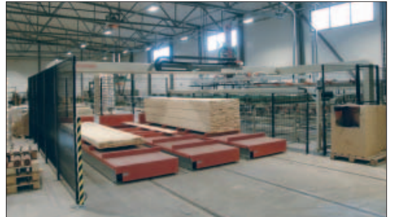
Yhtäaikaisesti voidaan käyttää kolmea sahatavarapituutta, jolloin omat pinoasemat sivuun siirtyvillä vaunuilla.

Tuotantoerä (esim. 1 päivä) annetaan suoraan tuotannonohjauksesta katkaisusahan optimointiohjelmalle. Katkaisusaha ja Pinomaticin laitteisto kommunikoi keskenään EtherNet-väylän kautta. Pinomaticin järjestelmä kertoo mitä sahatavarapituuksia on käytettävissä (maksimissaan 3 eri pituutta) ja saha tilaa oikean määrän oikean pituisia lautoja, joista Pinomaticin laitteisto valmistaa pikku nippuja sahan syöttöön. Katkaisus-